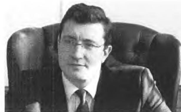
Первый заместитель Министра промышленности и торговли Российской Федерации Г.С. Никитин

Журнал «Эксперт» №27 (906) 30 июня 2014 г.