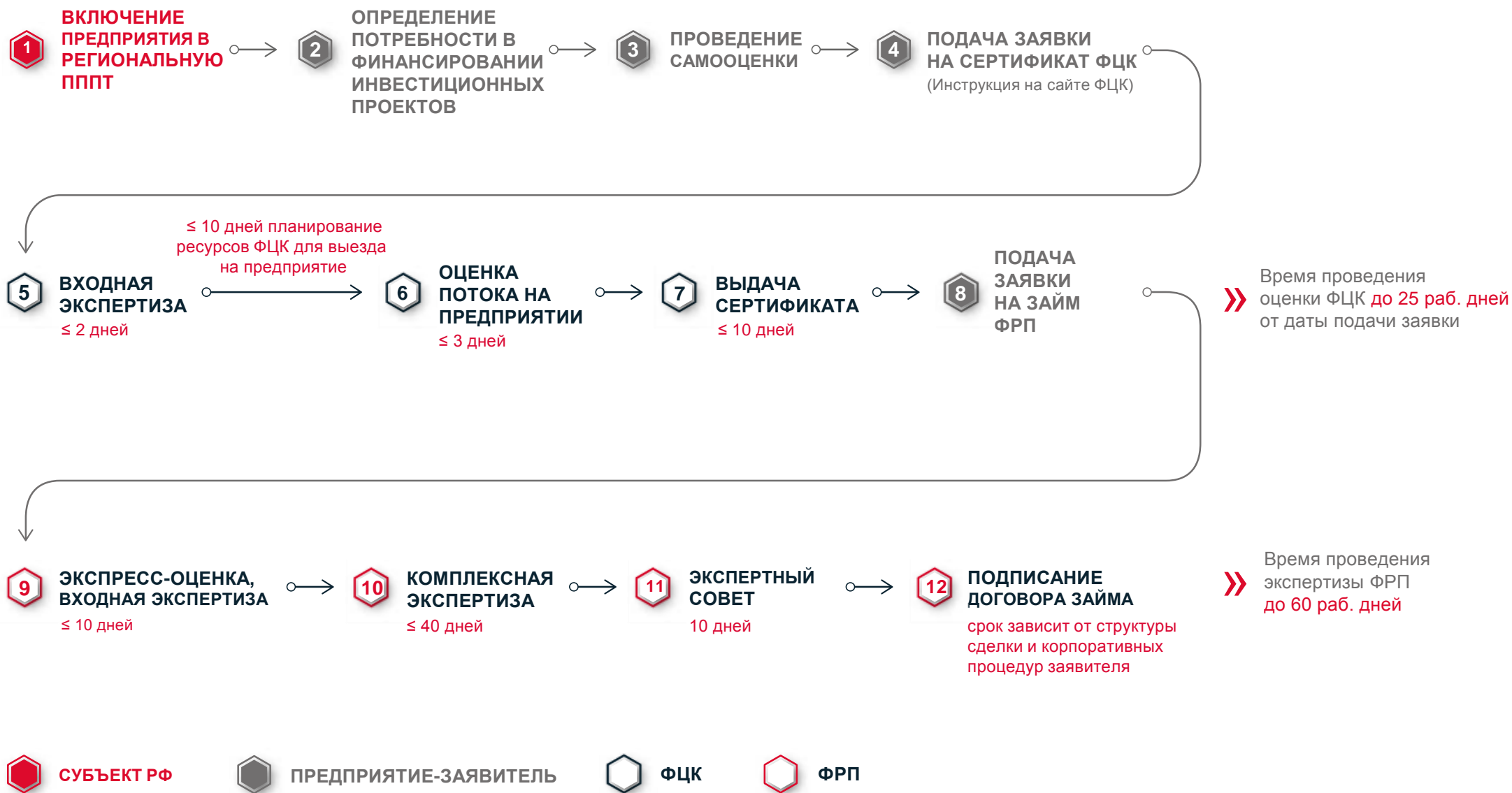
СХЕМА ПОЛУЧЕНИЯ ЗАЙМА НА ПРОЕКТ ПО ПОВЫШЕНИЮ ПРОИЗВОДИТЕЛЬНОСТИ ТРУДА